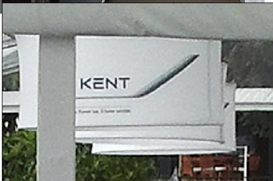
Photo No. 15 (et détail) – Vue sur l'entrée du Studio Modernity . La publicité pour la marque de cigarette Kent figure de façon proéminente dans cet espace.