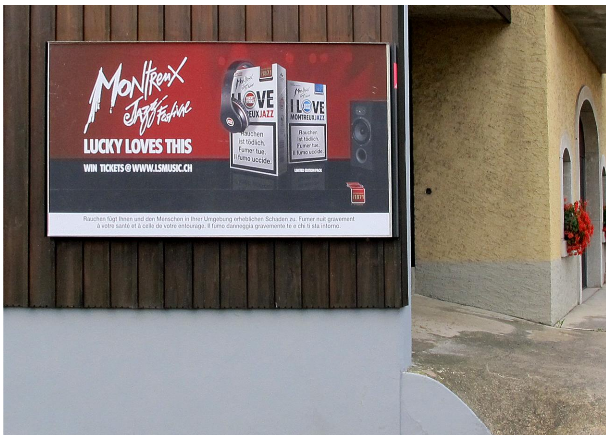
Photo No. 12 – Publicité que l'on retrouve sur les panneaux d'affichage du canton de Fribourg (ici, à Châtel-Saint-Denis)