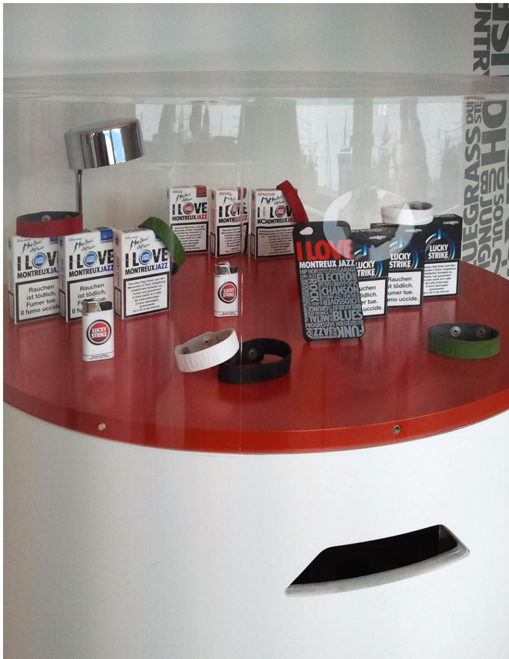
Photo No. 10 – Paquets de cigarettes et articles reprenant la charte graphique de la marque Lucky Strike associée à Montreux Jazz