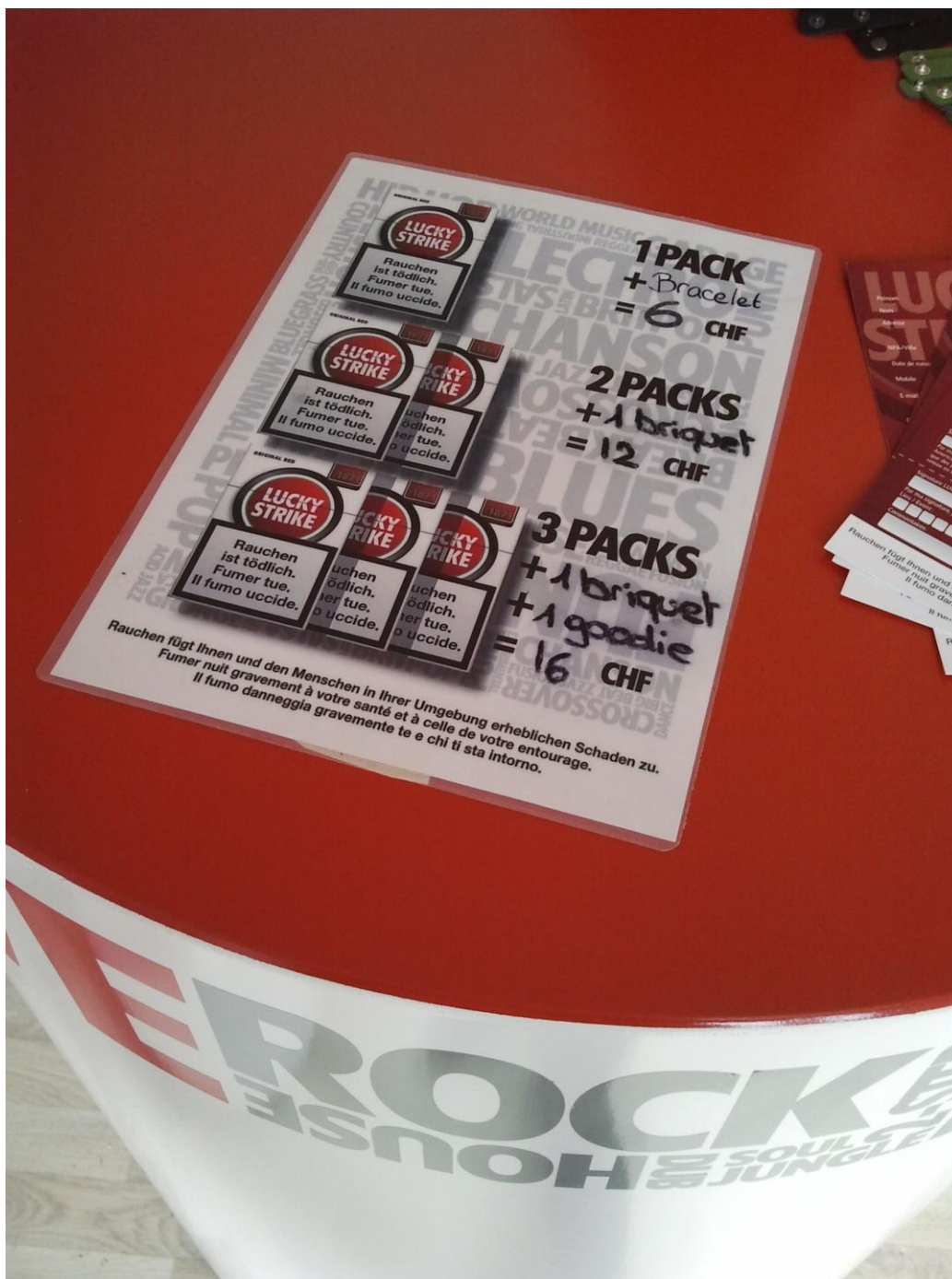
Photo No. 9 – Dans les stands, ventes de cigarettes à prix promotionnels avec cadeaux en prime.