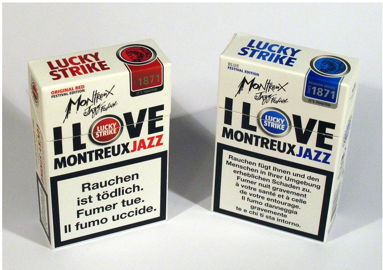
Photo No. 13 – Paquets de Lucky Strike Red et Blue, édition spéciale pour le Festival de jazz de Montreux