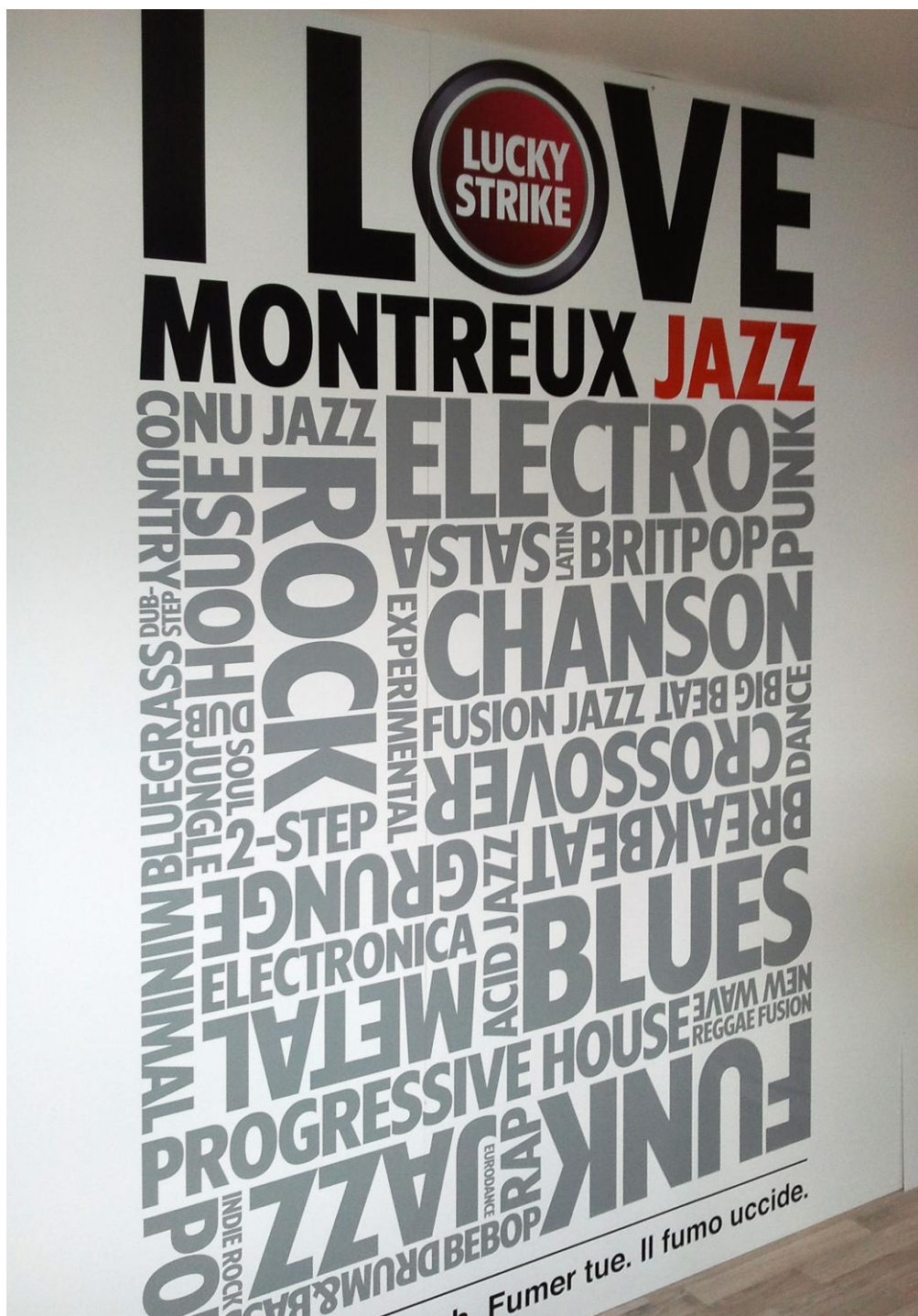
Photo No. 8 – Panneau publicitaire à l’intérieur d’un stand, très largement visible depuis l’extérieur à travers les grandes baies vitrées du stand.